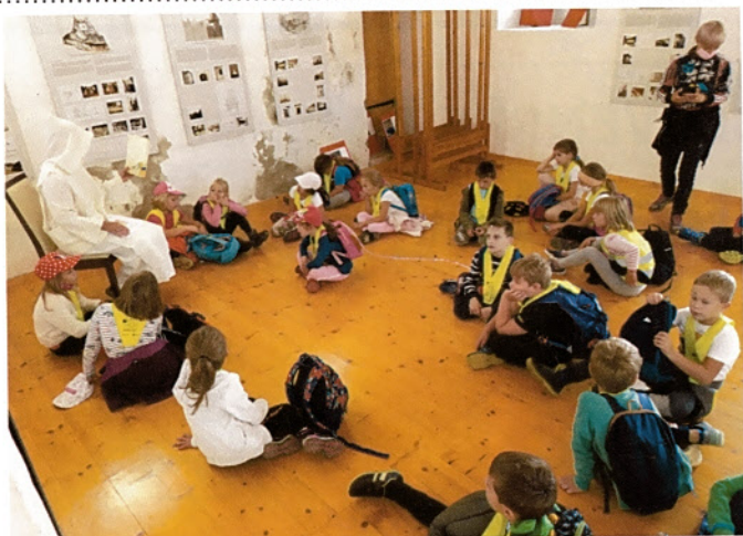
Drugošolci so bili navdušeni nad čarobnostjo Doline svetega Janeza in lepo urejenostjo novih šolskih bivalnih prostorov.