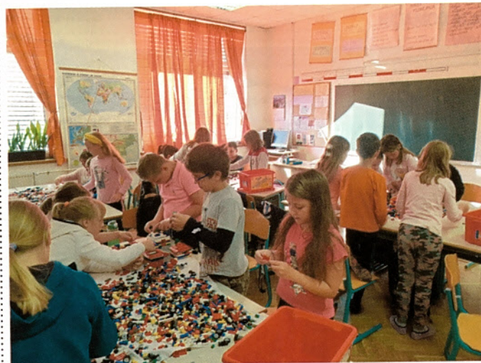
Z različnimi dogodki, aktivnostmi in delavnicami so na šoli obeležili teden umetnosti. Četrtošolci so prostorsko oblikovali. Iz lego gradnikov so ustvarili naselje, iz papirnega gradiva pa so samostojno narisali načrt za stavbo po izbiri, jo izdelali in se tako povezovali z likovno umetnostjo.