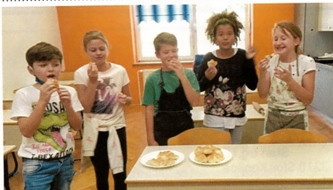
V tednu vseživljenjskega učenja so na šoli izvedli veliko delavnic, tudi kulinarčno. Petošolci so pekli kvašene rogljičke, kjer so učenci pokazali veliko ustvarjalnosti. Najbolj so jim šli v slast rogljički s čokoladnim polnilom.

čudoviti naravi ter preživeli dva nepozabna dneva druženja s šolsolci in učenkami iz Špitaliča.