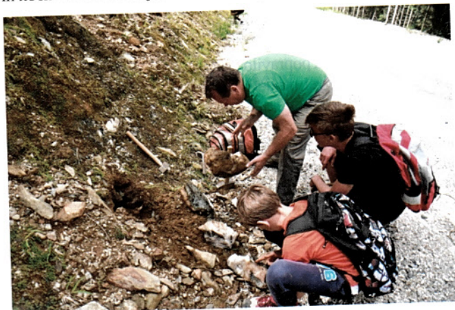
Tabor je odlična izbira za aktivne šolske počitnice.