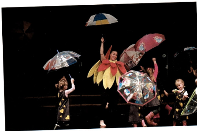
Vrtec je pel in plesal.

z vsako-mesečnimi kontrolami zob izvedli v Centru za zdravje Slov Konjice, so se za drugošolci šole Podgoro uvrstili učenci šole Vitanje – 5.b. razred in šole Stranice – 4. razred. (E. N.)