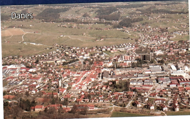
Današnji pogled na mesto s Skale – leto 2019.

... fotografije iz naših krajev in bi radi, da jih objavimo ter primerjamo z današnjim stanjem? Prinesite jih v Muzejsko zbirko na Stari trg 35 (telefon