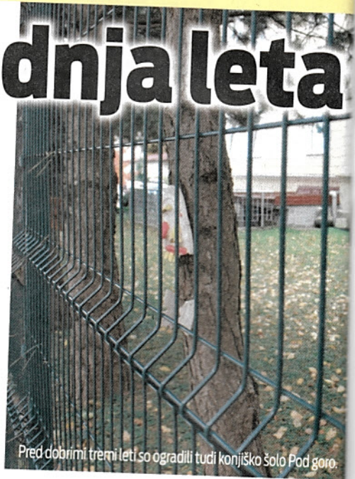
Pred dobrimi tremi leti so ogradili tudi konjiško šolo Pod goro.

Pri šoli Ob Dravinji so dva metra visoko zeleno ograjo okoli šole in zunanjih površin postavili pred osmimi leti, po ureditvi atletskega športnega parka. Ograja ščiti zunanje površine z igrali, nekaterimi igrišči in