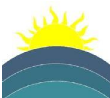
Slika 1: OŠ Pod goro Slovenske Konjice