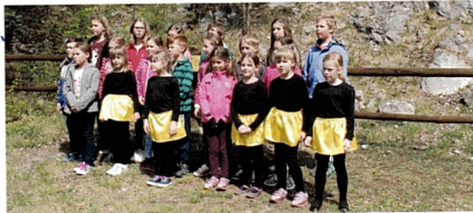
Nastopajoči so s pesmijo popestrili kulturni program.