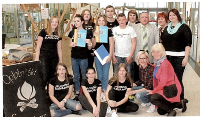
Celotna ekipa je v Mariboru poskrbela za odlično promocijo oplotniške občine in šole.