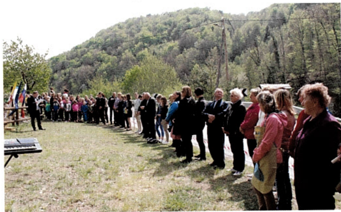
Žički grobeljnik so počastili s prireditvijo in obiskom.

Redka in ogrožena rastlina. Naravno in kulturno dediščino – endemit žički grobeljnik, so na rastišču v Žičah obujali v času njegovega najbujnejšega cvetenja.